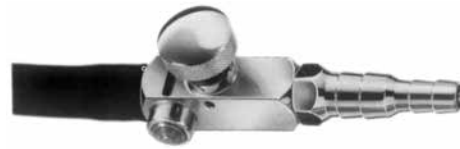
J 480.10 El vanası ve bağlantı borusu 20 cm uzunluğunda bağlantı borusu Hand valve with connection hose 20 cm long connection hose

The vacuum required can be constantly preset by the adjusting screw. This vacuum exists then up to the closed quick-shutter, thus the vacuum in the suction head is pressed from the left to the right, the nouted suction head is immediately put under the preset vacuum. In case the preset vacuum has to be changed, this can be done with the adjusting screw. For immediate removal of the suction head simply close the quick-shutter, thus the vacuum in the suction head is eliminated at once whereas the vacuum in the suction jar remains unchanged.